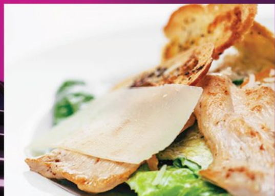
Салат Цезарь с куриной грудкой