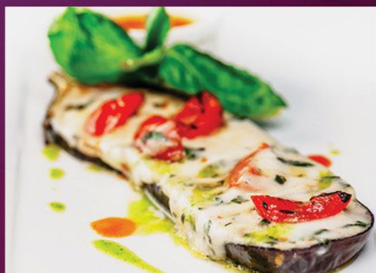
Баклажан запеченный с моцареллой